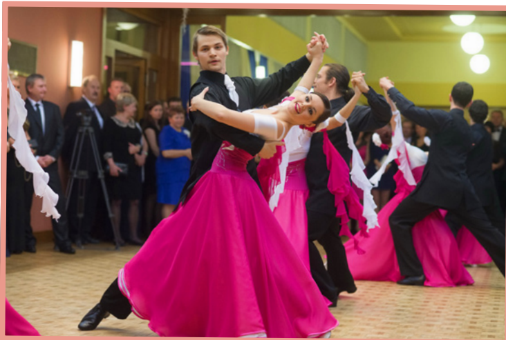
▲ Ples – Předtančení Taneční školy A. & A. Mědílkovi