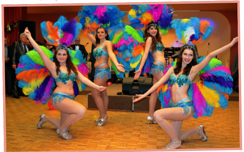
▲ Silvestr – Taneční vystoupení Oriana Dance Group