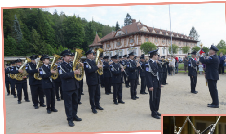
▲ ► Koncert Hudby Hradní stráže a Policie ČR