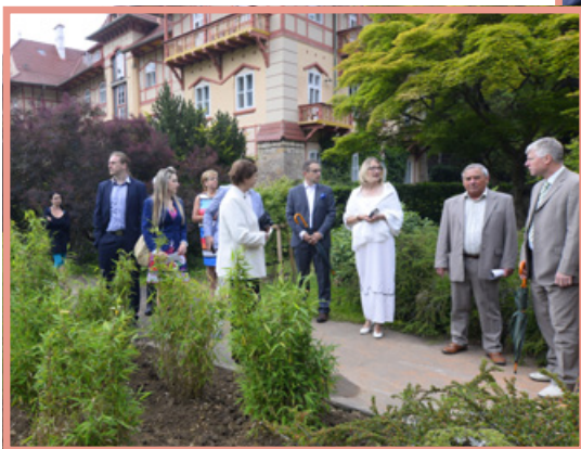
▲ Komentovaná prohlídka nově revitalizovaného lázeňského areálu