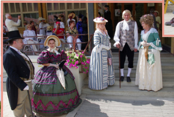
◀ Česká promenáda s Calmou