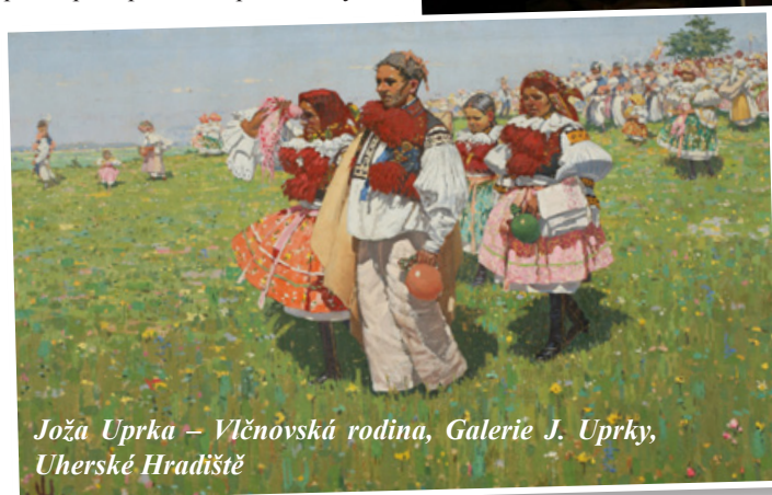
Joža Uprka – Vlčnovská rodina, Galerie J. Uprky, Uherské Hradiště