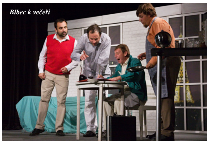
Blbec k večeri