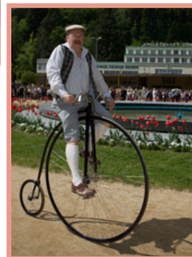
▲ ▼ Otevírání pramenů 2014