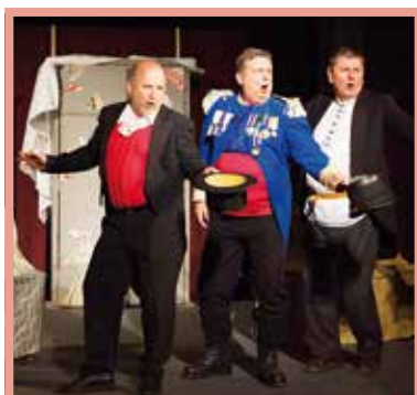
Divadlo Post Scriptum v komedii To jsi teda přehnal na Luhačovické divadelní sešlosti.