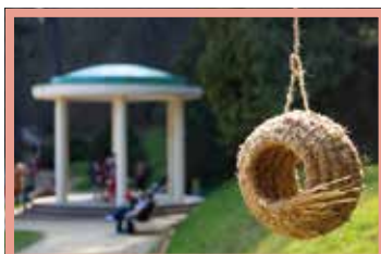
Další krmítko, tentokrát u Ottovky.