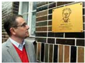
Osobnosti Karla Maye bylo věnováno i letošní zahájení sezony.