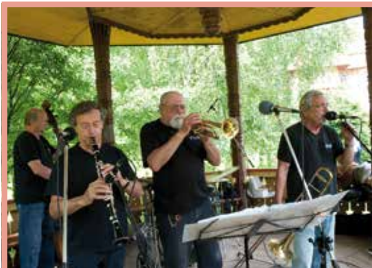
Vystoupení dixielandu Jazzzubs při Setkání řezbářských mistrů.