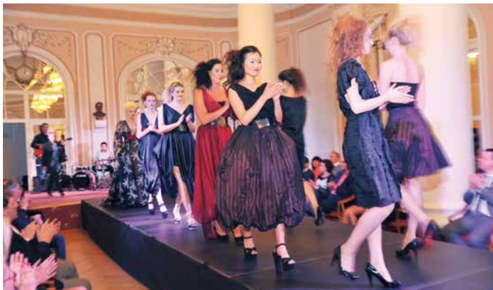
Módní přehlídka Ivany Follové.