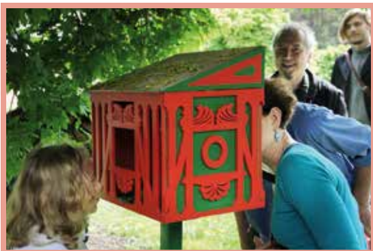
Jedno z krmítek zhotovených v rámci Slavností ptačích budek.