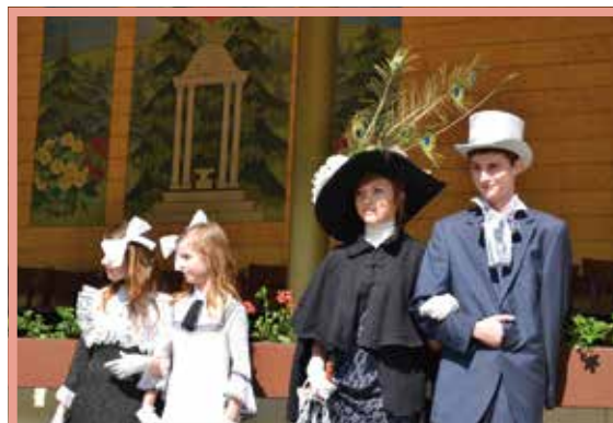
Otevírání pramenů – Promenáda u Slanice.