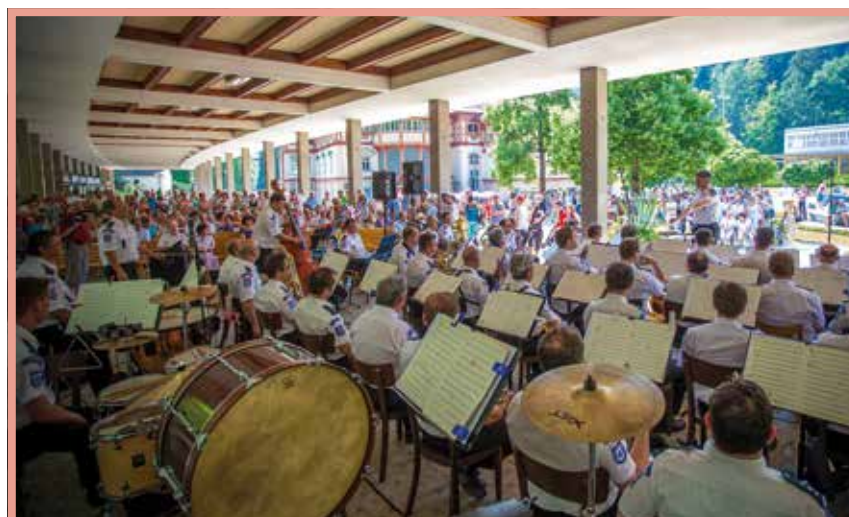
Koncert Hudby Hradní stráže.