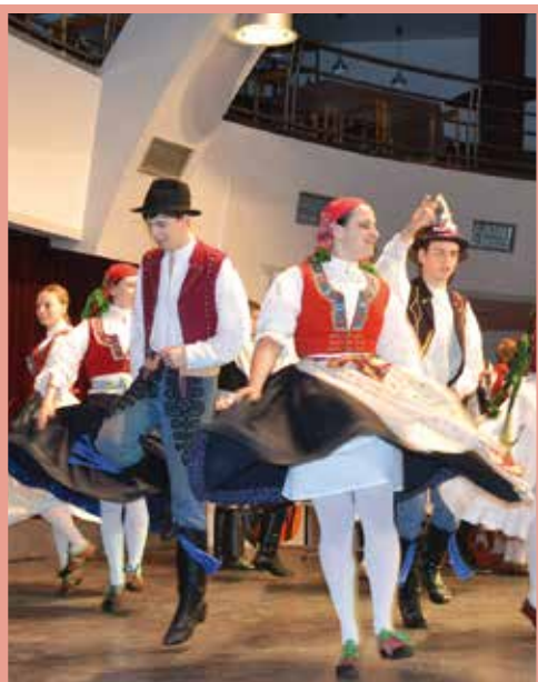
Otevírání pramenů – Folklorní soubor Malé Zálesí.