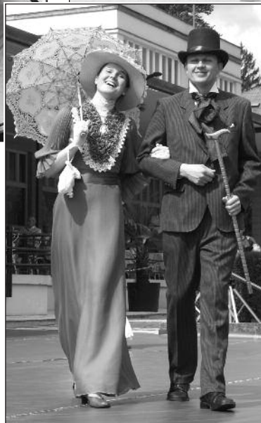
Lázeňská módní abeceda – výstava v hale Vincentky