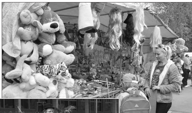
Jarmark byl lákadlem