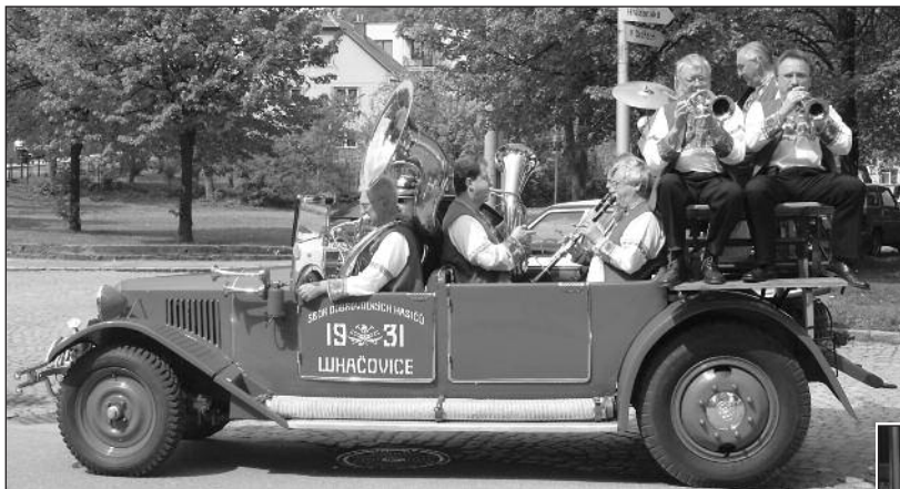
Zálesanka s pozvánkou