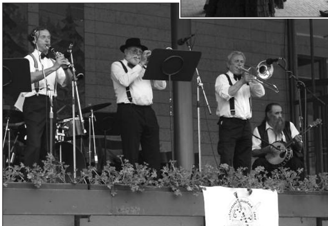
Na promenádě dnes... Dixieland Band Jazzzubs