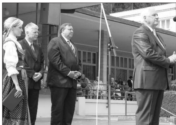
Nedělní program zahájili představitelé kraje, města a Lázní