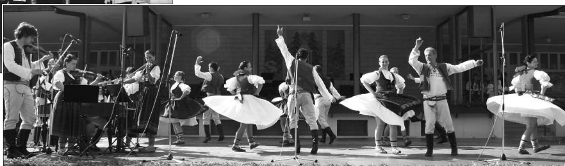
Návrat k tradicím – folklorní soubory Malé Zálesí Luhačovice, Kornička z Trenčína, Dolina ze Starého Města a Portáš z Jasenné