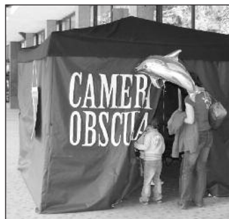
Secesní fotoateliér i Camera obscura