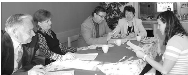
Jako každoročně uspořádala i letos a. s. Lázně Luhačovice od 16. 2. do 9. 4. akreditovaný kurs sanitářů. Jeho obsahem bylo 100 hod. teorie zaměřené na tělovědu, hygienu, balneologii, práci sanitářek a první pomoc a 50 hod. praktického výcviku. Celkem 18 frekventantek složilo úspěšně závěrečnou zkoušku (na snímku) a získalo Osvědčení Sanitář pro lázně a léčebnou rehabilitaci s celorepublikovou platností.