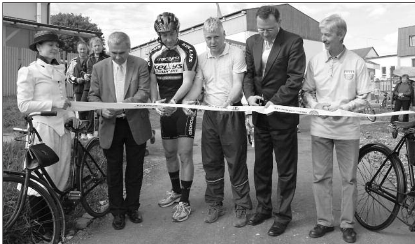
Slavnostní otevření cyklostezky mezi Luhačovicemi a Biskupicemi