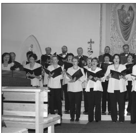
Kostel Sv. Rodiny – koncert ZUŠ a Smišeného pěveckého sboru Leoše Janáčka Luhačovice