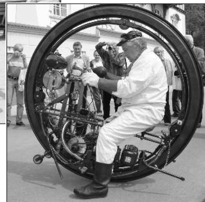
Na promenádě před 100 lety – módní přehlídka Luhačovický okrašlovací spolek Calma