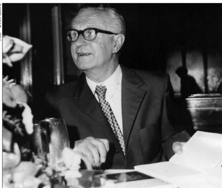
Spisovatel František Kožík na besedě s autogramiádou v Luhačovicích v roce 1974

Naše lázně byly i místem jeho pravidelných besed se čtenáři. Konaly se ponejvíce v komorním prostředí Lázeňského divadla. V odpovědích na otázky svým příznivcům vyprávěl o vlastní literární práci, vyznával se z lásky k rodnému kraji a vlasti, pronášel