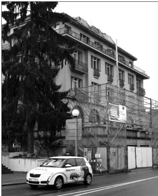
Alexandria I těchto dnů – horké staveniště