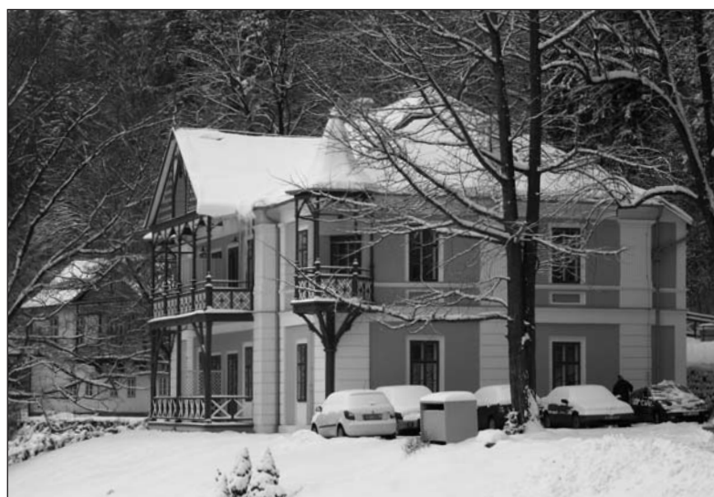
Vila Alpská růže umožňuje zažít zimní pohádku