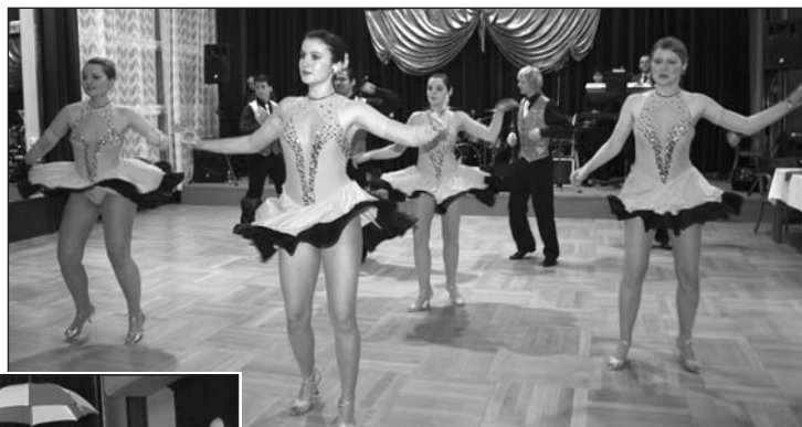
Mix Latina a Kabaret (koncertní sál) nastavila laťku vysoko