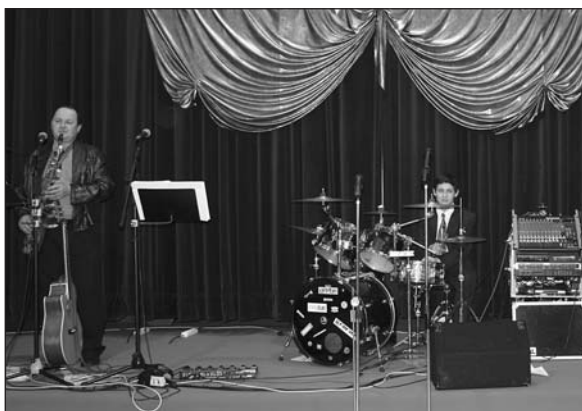
MM Band plnil parket v koncertním sále