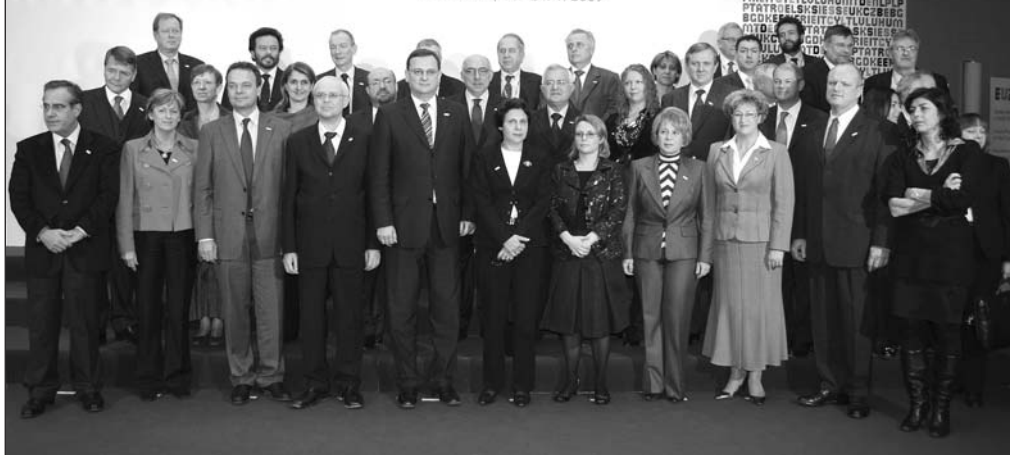
Společné foto účastníků