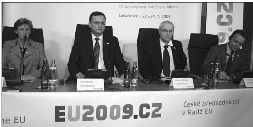
Závěrečná tisková konference