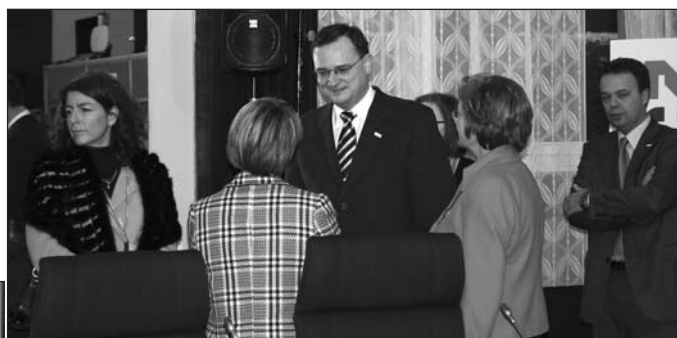
Než zasednou k jednacímu stolu