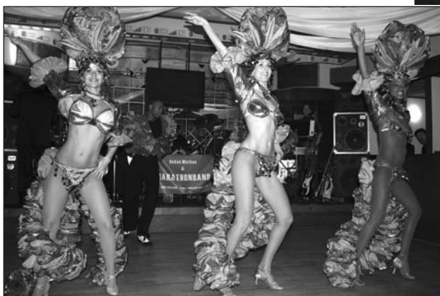
Tradición-Grupo de Baile – přiblížil karneval z Ria de Janeiro