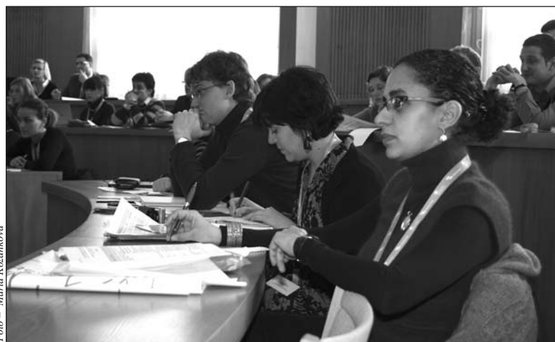
Mladí lidé z celé Evropy diskutovali v Luhačovicích o své budoucnosti

ČR jsem navštívil ještě před vstupem ČR do EU, poprvé v r. 1996, v té době jsem pracoval přímo v Evropské komisi (EK) a zaměřoval jsem se na vztahy nových členských států a jejich přístupová jednání s EK. Už si nepamatuji, kolikrát jsem navštívil Zlínský kraj, ale bylo to mnohokrát. Znáám ho proto velmi dobře a Luhačovice také. Bydlel jsem tu v hotelu Palace, v Jurkovičově domě, několikrát jsme si prošli kolonádu. Organizovali jsme evropský projekt pro Zlínský kraj, který je financován EK, a zde byl jeden z workshopů tohoto mezinárodního projektu, kdy jsme přivedli partnery z různých zemí přímo do Luhačovic. Takže Luhačovice využíváme jako výborné místo pro organizování mezinárodních akcí. A součástí týmu bruselského Zastoupení ZK jsou lidé ze Zlínského kraje.