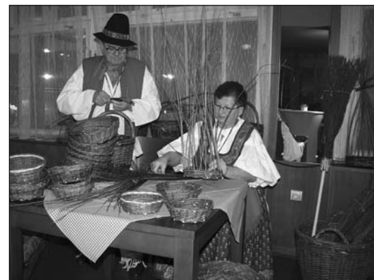
Na moravském večeru nechyběla ukázka lidových řemesel