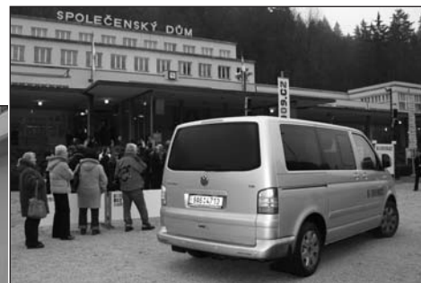
Delegáti postupně přijíždějí