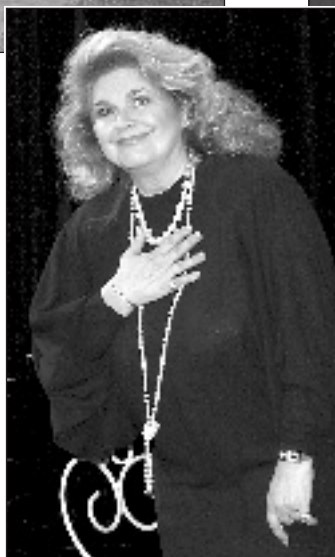
Gabriela Beňačková – Mařenka i Rusalka