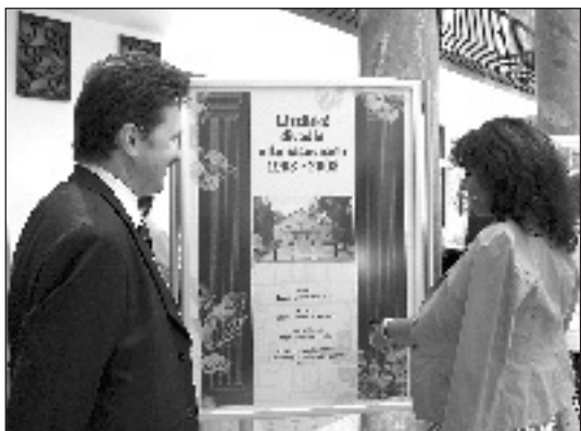
Vernisáž výstavy Lázeňské divadlo v Luhačovicích 1908-2008 hala Vincentky