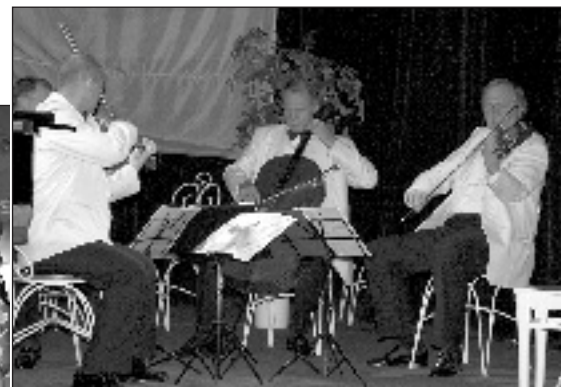
Janáčkovo kvarteto s úryvky Janáčkovy hudby