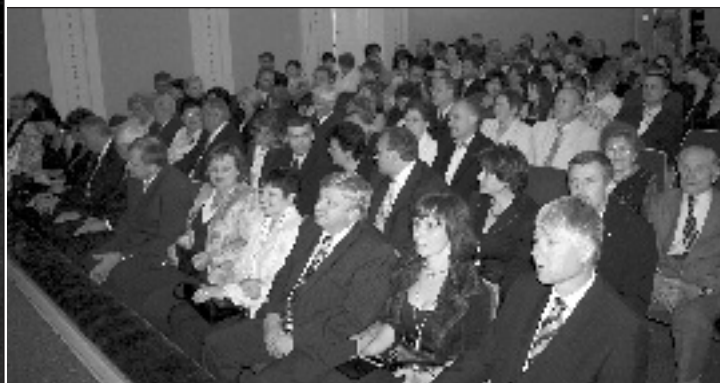
Publikum již napjatě očekává