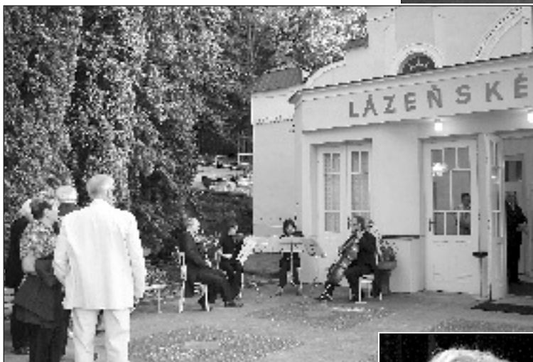
Kvarteto (z Filharmonie B. Martinů Zlín) vytvářelo atmosféru před Lázeňským divadlem