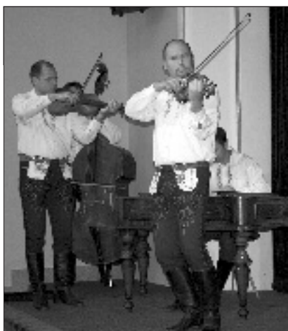
Varmužova cimbalová muzika – sepětí s Moravou