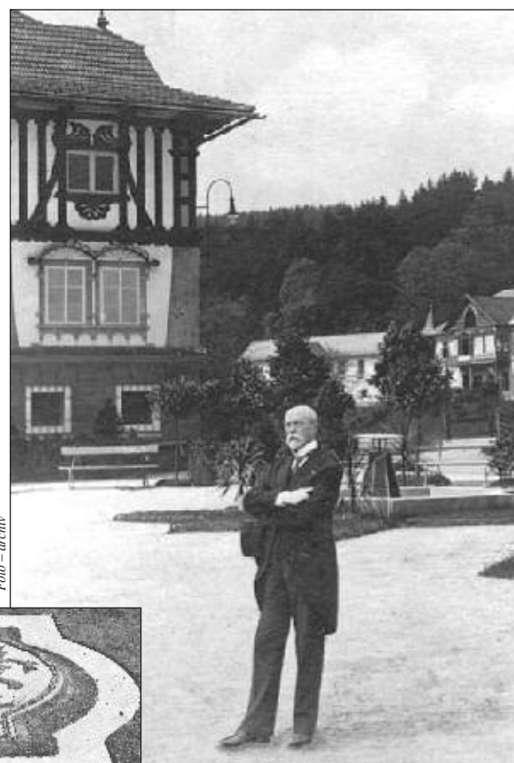
Prezident T. G. Masaryk navštívil Luhačovice při své cestě Moravou v červnu 1924 (podrobněji viz reportáž v LL č. 17 z 15. října 1998)

Podobně jako v ostatních městech a obcích naší republiky zavlály také v Luhačovicích 28. října státní vlajky na státních a veřejných budovách, aby připomněly, že před 90 lety pod vedením budoucího prvního prezidenta Tomáše Garrigue Masaryka byl vytvořen samostatný demokratický stát. Oslavy tohoto významného výročí proběhly v Praze, Brně, ale i v dalších městech a obcích, kde byly položeny květiny a věnce k sochám a bustám prvního prezidenta i pomníkům obětem první světové války, byly uspořádány výstavy připomínající např. československé legie v Rusku 1914-1920, vojenskou dobovou techniku, ale i přímo 28. říjen, připomínková shromáždění s projevy i slavnostními koncerty. Rovněž média uveřejnila ke státnímu svátku oslavné i polemické články v novinách a diskusní debaty historiků či dokumentární pořady byly vysílány na rozhlasových vlnách či televizních obrazovkách. Naše veřejnost si tak připomněla převratné historické události, jež předcházely důležitému okamžiku našich dějin, kdy 28. října 1918 zaplnili Pražané ulice a odpoledne na Václavském náměstí vyhlásili samostatnou Československou republiku. LL