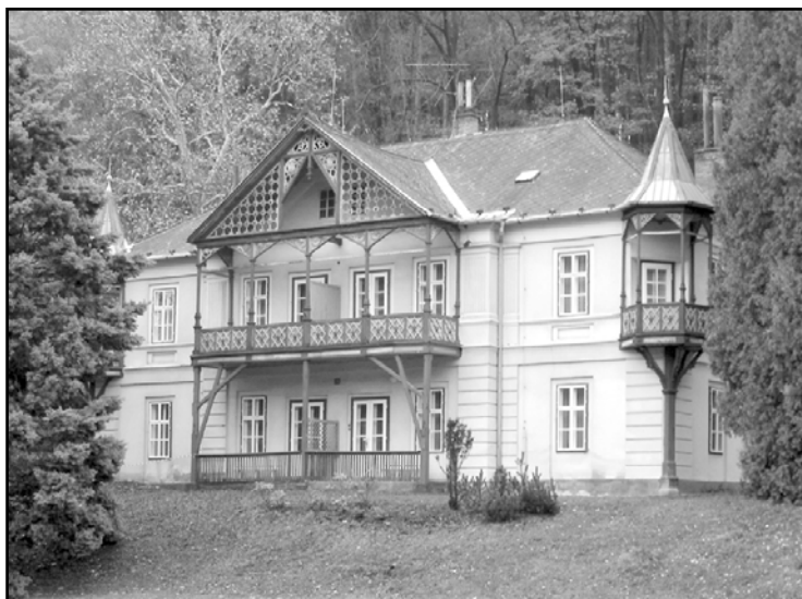
Z historického objektu bude za půl roku moderní, špičkový penzion.

Jde o pětistou dvanáctou známku, kterou Česká pošta vydala. A proč se rozhodla k této emisi? „Luhačovice patří k našim nejkrásnějším lázním. Krásnou přírodou citlivě doplňuje unikátní architektura lázeňských domů ve stylu lidové secese, která je dílem Dušana Jurkoviče,“ uvádí se v oficiálním prohlášení České pošty. (kra)