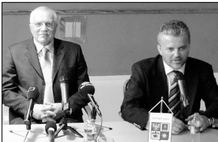
Prezident České republiky Václav Klaus a hejtman Zlínského kraje Libor Lukáš při tiskové konferenci v Baťově mrakodrapu - sídle Zlínského kraje.

Návštěva z nejnáměnitelnějších zavítala v polovině března do Zlínského kraje. Na třídní oficiální návštěvu přijel prezident České republiky Václav Klaus s chotí Livíí. Prezidentský pár při své druhé oficiální návštěvě Zlínského kraje sice nezavítal do Luhačovic, ale jeho přítomnost v okolních městech - Zlíně, Uherském Hradišti, Bojkovicích, Slavičíně či Valašských Kloboukách bylo možné vyušit nejen ze všech médií, ale návštěva pana prezidenta byla jedním z hlavních témat rozhovorů mezi lidmi na lázeňské kolonádě. Prezident zahájil svou cestu ve Vlčnově - místu, kde se zrodila legendární jízda králů. Po celou dobu jej doprovázel hejtman Zlínského kraje Libor Lukáš s manželkou, na jejichž pozvání také prezidentský pár přijel. „Velmi si cením atmosféry optimis-