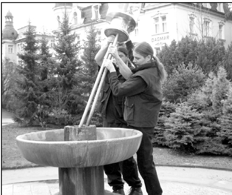
Pracovníci Lázní zprovozňují pramen Dr. Šťastného.

Pramen Dr. Šťastného je hydrouhličitanochloridosodná kyselka. Název je odvozen z jeho složení, kde téměř výhradním aniontem je hydrouhličitan a chlorid. Významnou vlastností pramene Dr. Šťastného a vlastně všech luhačovických minerálních vod je jejich vysoká proplytnost volným oxidem uhličitým. (kra)