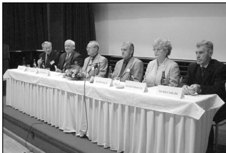
Slavnostní zahájení XIV. Luhačovických dnů.

Poprvé se letos Luhačovických dnů zúčastnily také zdravotní sestry, které si ve svém zvláštním kongresovém bloku vyměňovaly zkušenosti především z terénní praxe. Ještě v předvečer Luhačovických dnů se také v Lázních sešel ke svému zasedání Výbor České pneu-