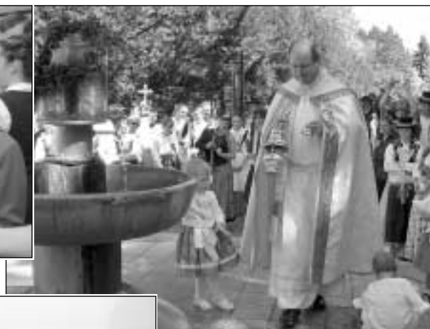
Otevíráním pramenů se lázeňská sezona zahajuje (11.-13. května)