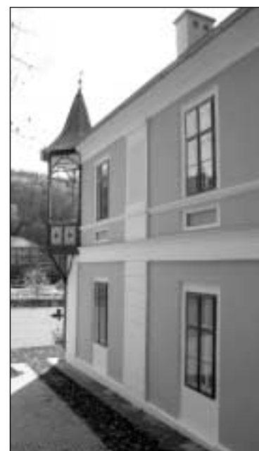
Vila Alpská růže slouží po rekonstrukci náročným hostům (listopad)