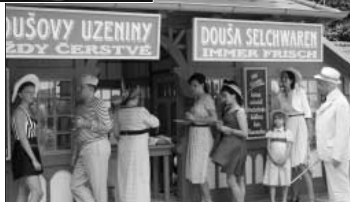
Ve Slunečních lázních natáčela ČT Brno (27.-28. července)