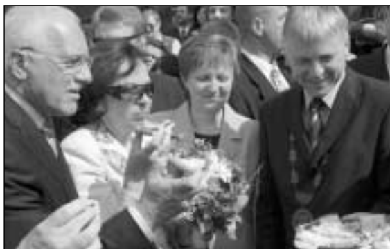
Setkání prezidentských párů ČR a SR proběhlo v Luhačovicích (3.-4. dubna)