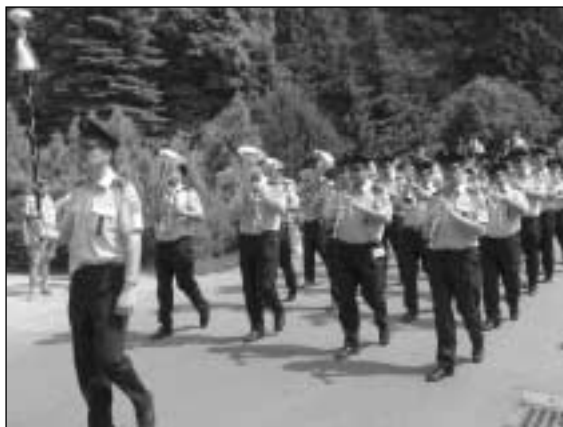
Hudba Hradní stráže a Policie ČR zaplní vždy Luhačovice (21. června)