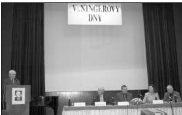
Také Ningerovy dny přispívají k odborné prestiži Lázní Luhačovice, a. s.

bytů. K tomuto vývojovému trendu velmi přispívá i dobré jméno Lázní Luhačovice ve vědomí naší i zahraniční veřejnosti, pravidelná odborná setkávání lékařů a medicínských odborníků různých profesí, kteří mají při těchto příležitostech možnost se seznámit a přesvědčit o vysoké úrovni poskytovaných léčebných lázeňských služeb v naší společnosti.