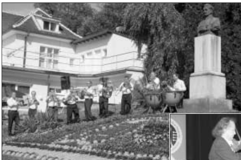
16. ročník hudebního festivalu Janáček a Luhačovice (23.-27. července)