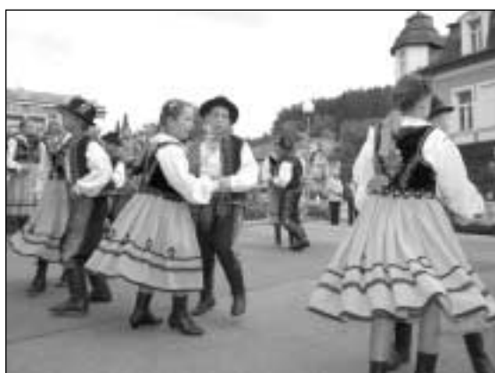
XV. mezinárodní festival dětských folklorních souborů - Písni a tancem - Luhačovice 2007 (7.-9. září)