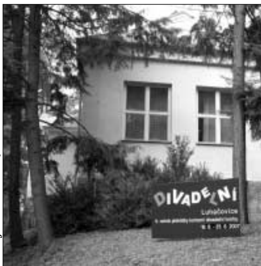
9. ročník Divadelních Luhačovic je svátkem divadla (20.-26. srpna)