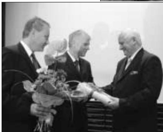
Generální ředitel Lázní Luhačovice, a. s., Podnikatelem Zlínského kraje roku 2006 (22. června)