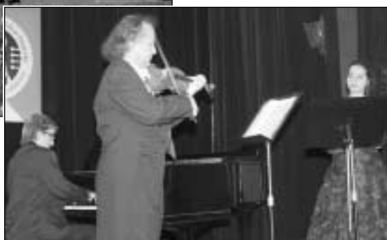
Akademie Václava Hudečka láká mladé houslisty (31. července - 1. srpna)